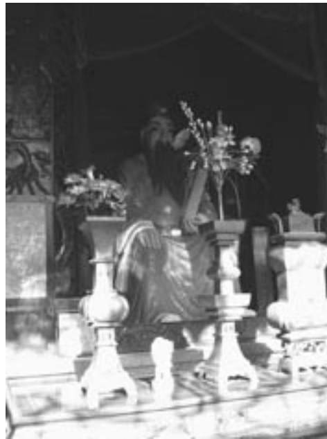
圖二、二世祖鍾玉岩像