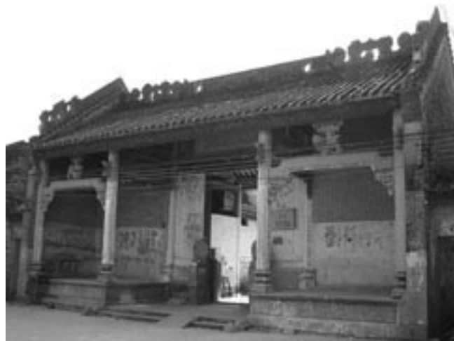
圖三、十世昆山祖祠