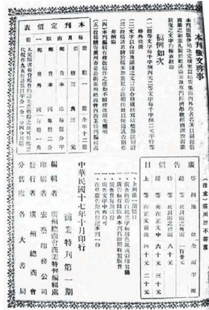
附件一（乙）：《商業特刊》之出版頁