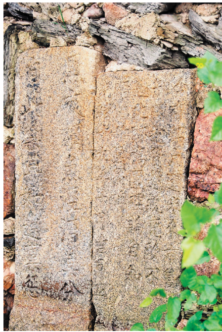
圖八、過山碼頭前石碑