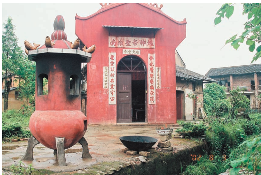
圖十五、南嶽聖帝神壇