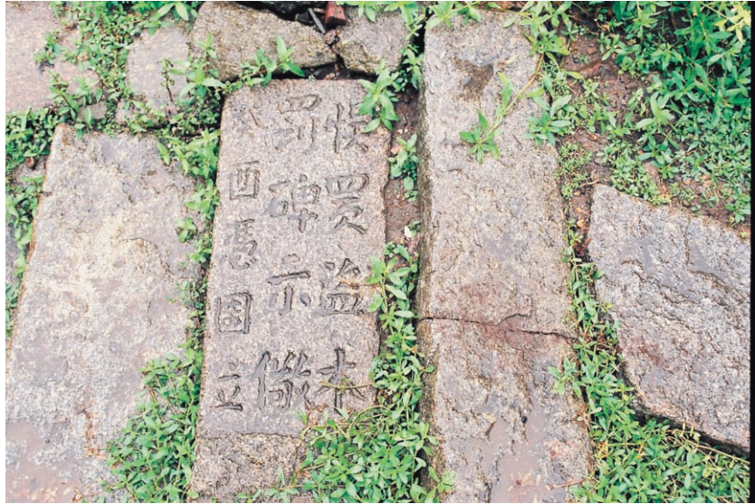
圖十二、放在地上的石碑