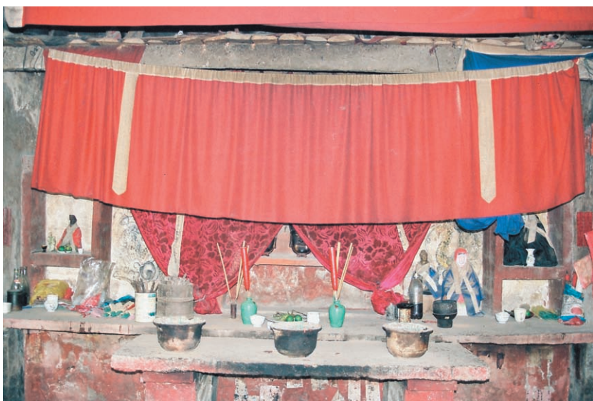
圖四、靈官廟神壇（注意中央的兩具面具）