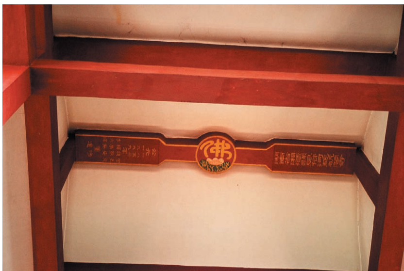
圖十七、慈航閣寺橫樑