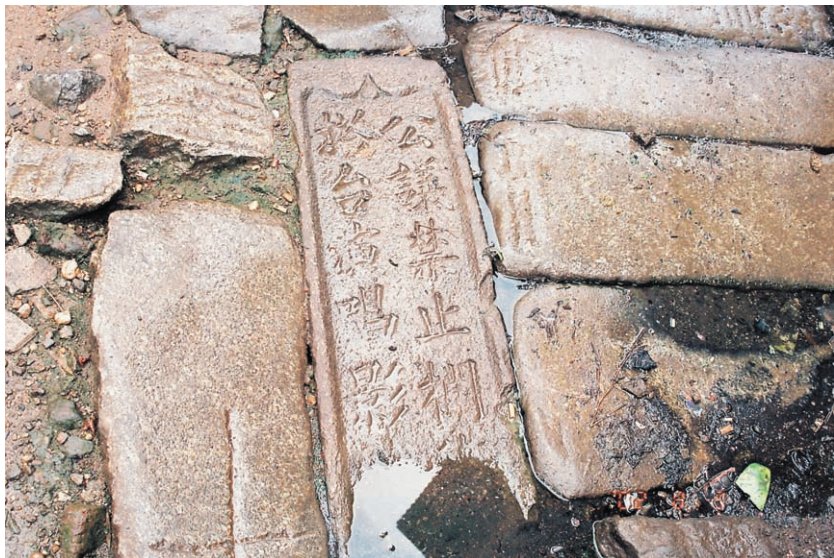
圖十四、放在地上的石碑