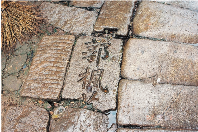
圖十三、放在地上的石碑