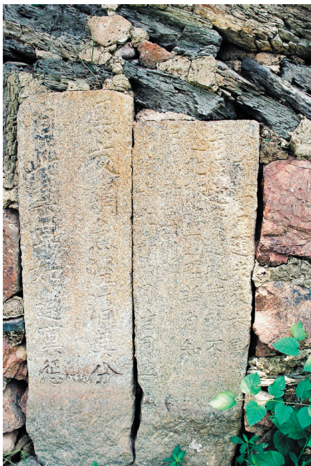
圖七、過山碼頭前石碑