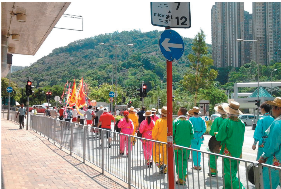
圖5：迎神和巡境的隊伍。