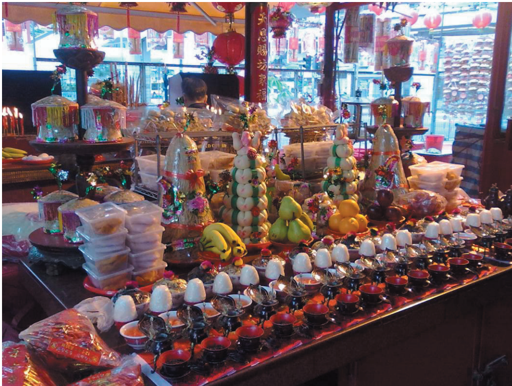
圖3：聯誼會準備的祭品，如茶、酒、潮州湯圓、潮州茶果和水果等。