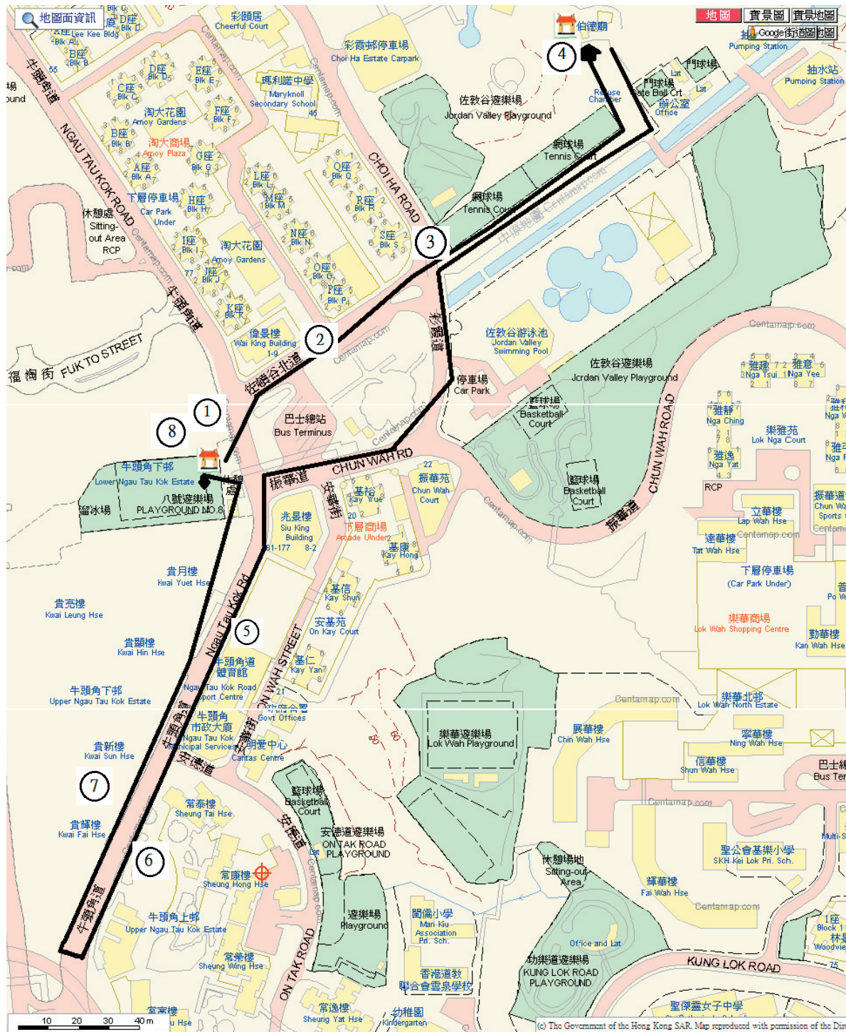
圖7：牛頭角福德廟盂蘭勝會迎神和巡境路線圖