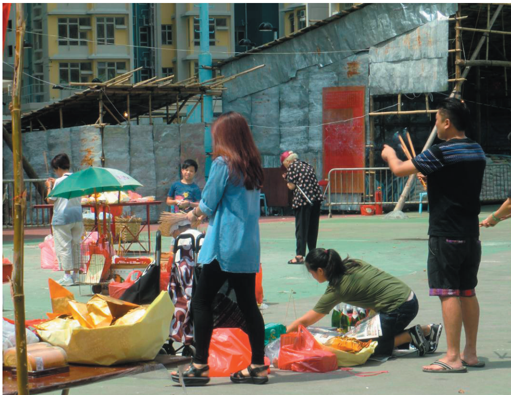
圖9：各善信帶備了祭品前往拜神。