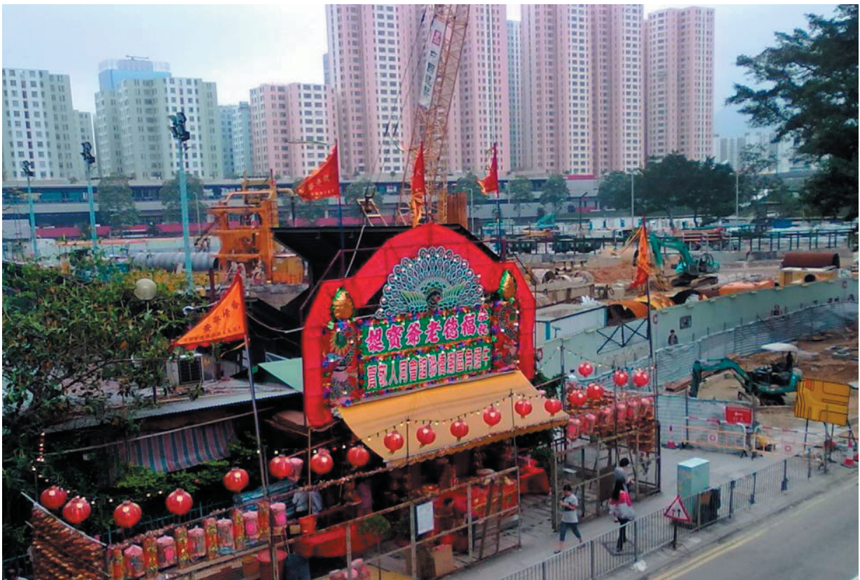
圖1：牛頭角福德廟。2012年。