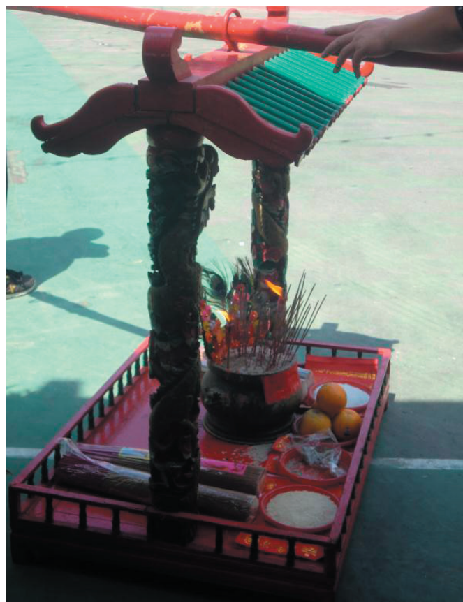
圖6：迎神和巡境隊伍所請得的佐敦谷福德伯公古廟的伯公香爐。林佩玲2012年拍攝。