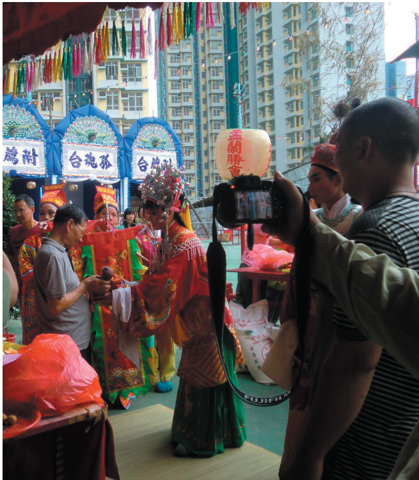
圖8：劇團的花旦把「龍王太子」交到聯誼會總理手上。