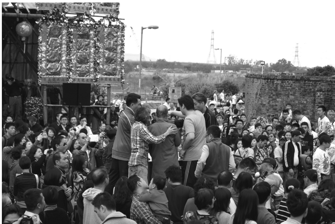
圖5、2013年村代表抽炮的情況。