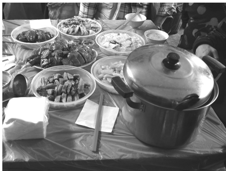
圖3、丁粥宴食物十分豐富。