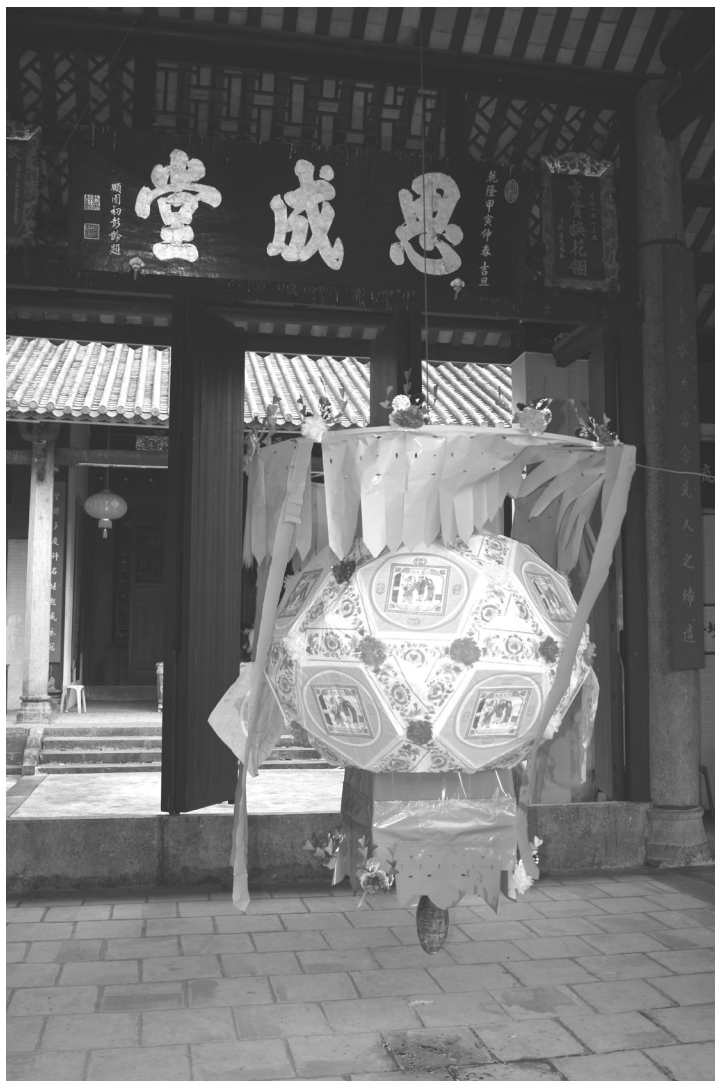
圖2、懸掛在思成堂內的一盞大的紙質燈籠。李顯偉拍攝。