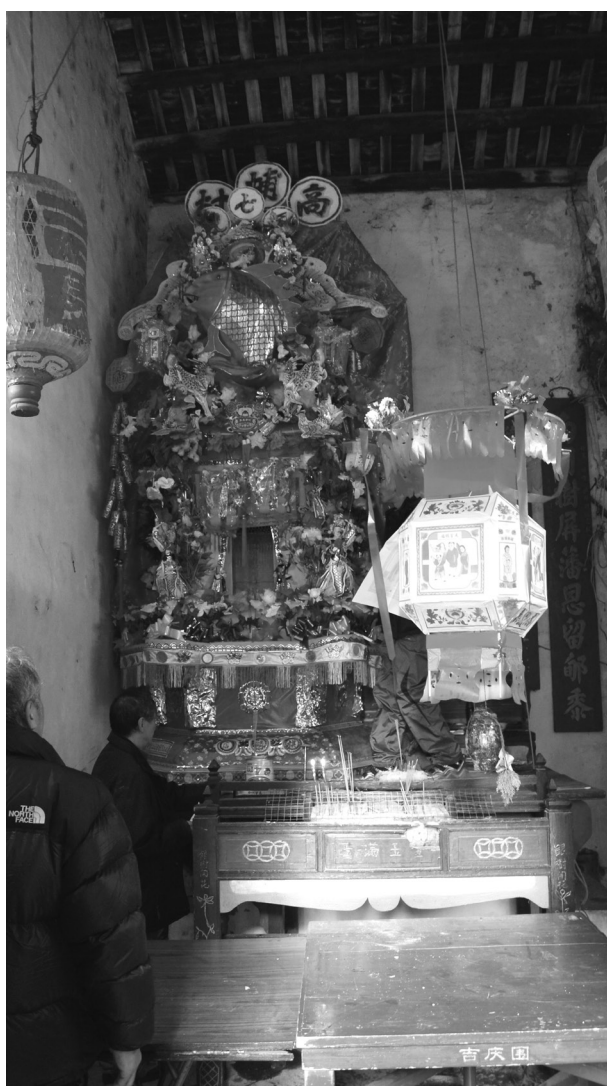
圖7、村民把花炮抬回神廳供奉一年。