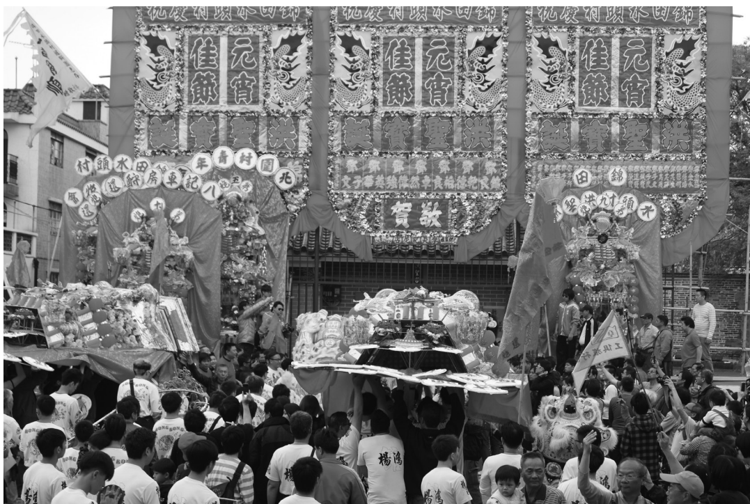
圖4、還炮的情況。李顯偉拍攝。