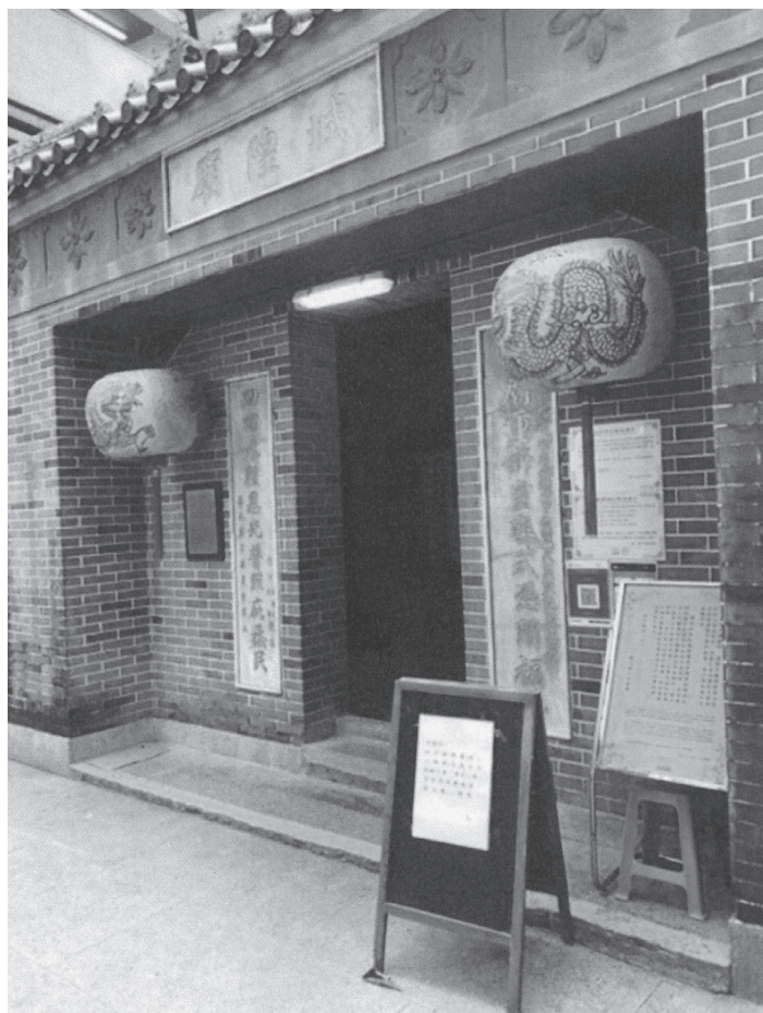
圖3、廟宇第一進大門圖。