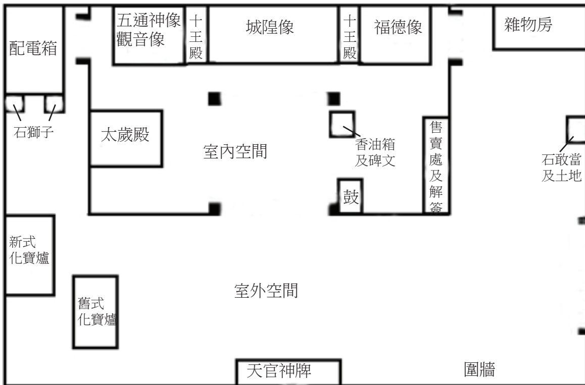
圖2、筒箕灣城隍廟的平面圖。